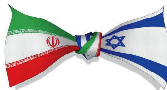
Artist: Nathaniel Cohen

“[...] their people shared one of the oldest and most complex relationships in the Middle East”.