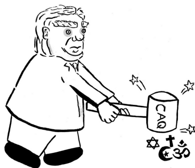
Artist: Léa Bozobka

If the Quebec government decides to move forward with this law, it is essential that it clarifies the definition of "public space" and ensures that the legislation distinguishes between political demonstrations and faith-based observances. Taking these actions into consideration would help protect both secular values and religious rights within Quebec's diverse society.