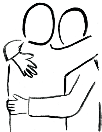
Artist: Léa Bozobka

Taken together, these two lessons – from Bereishit and from Noach – reveal something fundamental about our purpose in this world. God did not want humanity to exist in solitude. We are meant to grow, to learn, and to strive for goodness together . Righteousness in isolation is incomplete. True goodness, the kind that God calls "very good," happens when we connect, help each other, and elevate those around us.